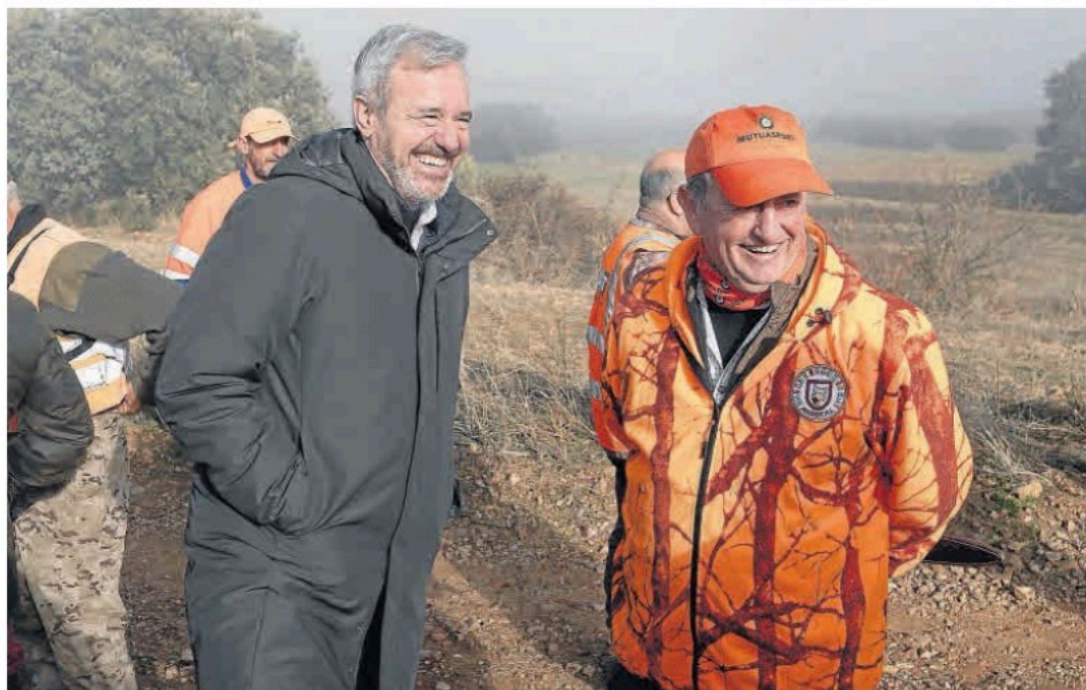
Jorge Azcón, presidente en funciones de la DGA, durante una visita a cazadores en el coto de Villarreal de Huerva.