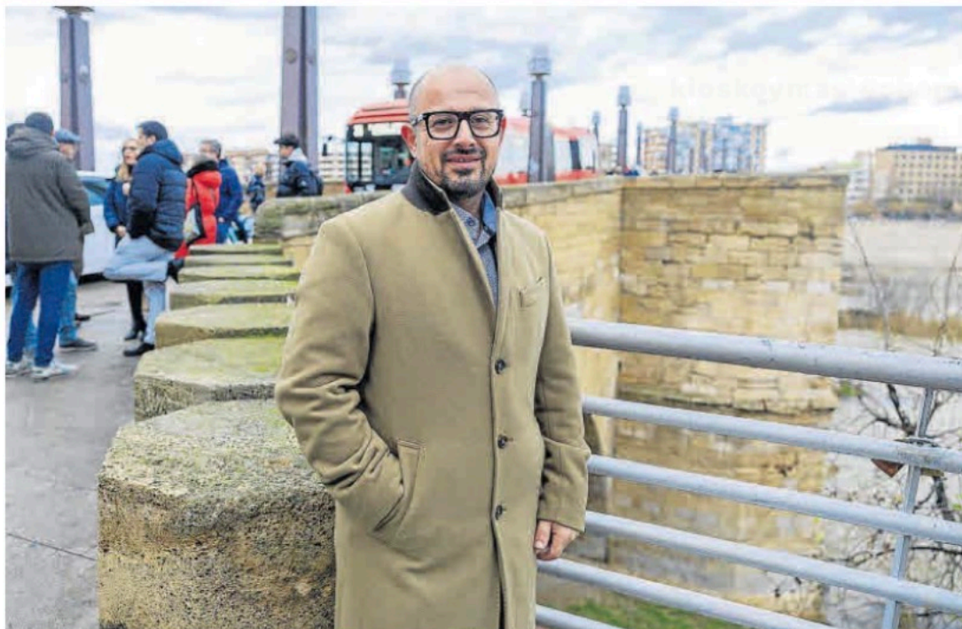
Alberto Izquierdo, candidato del Partido Aragonés a la presidencia de la Diputación General de Aragón.