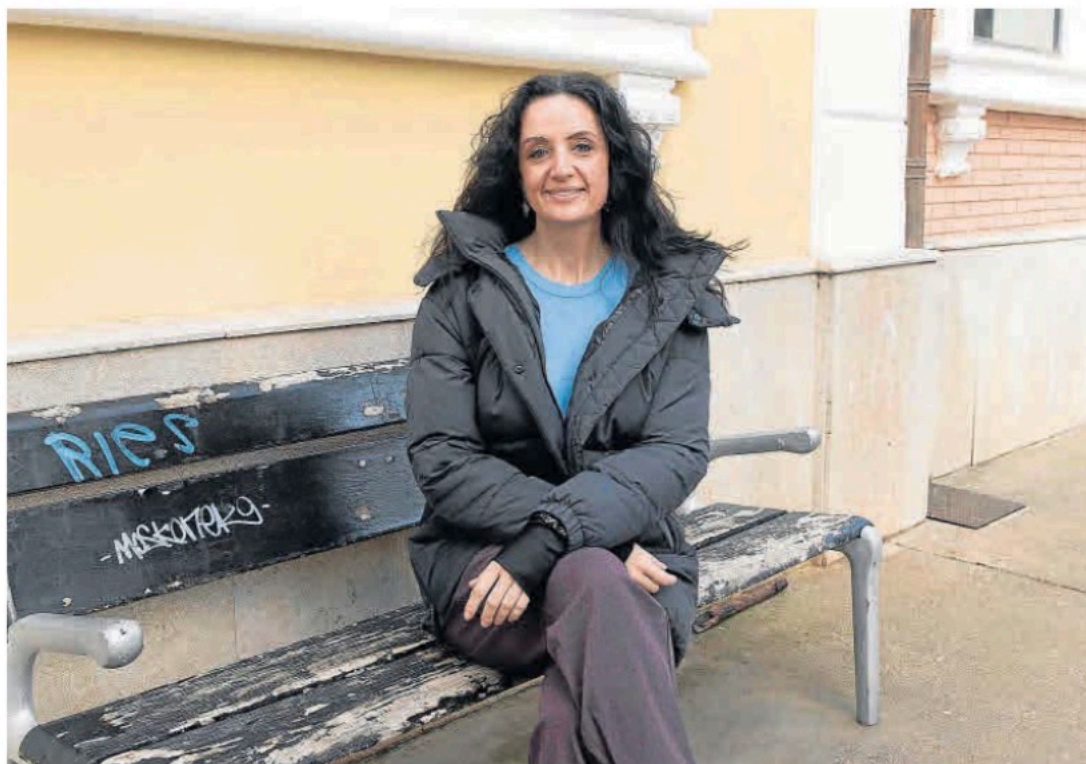
Marta Abengochea, candidata de IU-Movimiento Sumar a la presidencia de la DGA.