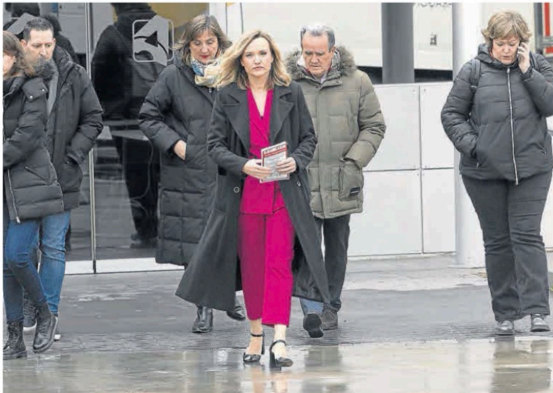
Pilar Alegría, candidata a la presidencia de la DGA por el Partido Socialista.