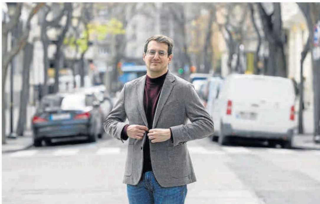
Jorge Pueyo, candidato de Chunta Aragonesista a la presidencia del Gobierno autonómico.